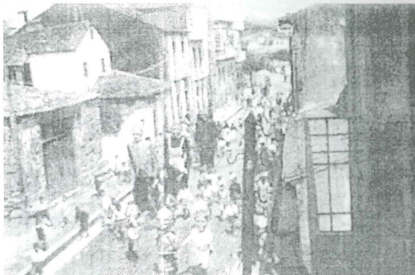
Los Gigantes de A Pobra en la actual Rúa da Paz, años 50.

Con sus cinco gigantes y veintiún cabezudos, la comparsa de la cofradía de O Carme dos Pincheiros es en la actualidad la mayor agrupación de gigantes de Galicia y cuenta con una tradición documentada desde principios del siglo XX 1 . Salen dos o tres veces por las calles de la villa en las fiestas patronales de la Virgen del Carmen que se celebran en la tercera semana de agosto, acompañados de grupos de gaitas y charangas asistiendo – los gigantes solamente – en el atrio de la iglesia a la salida de la procesión mariana 2 .