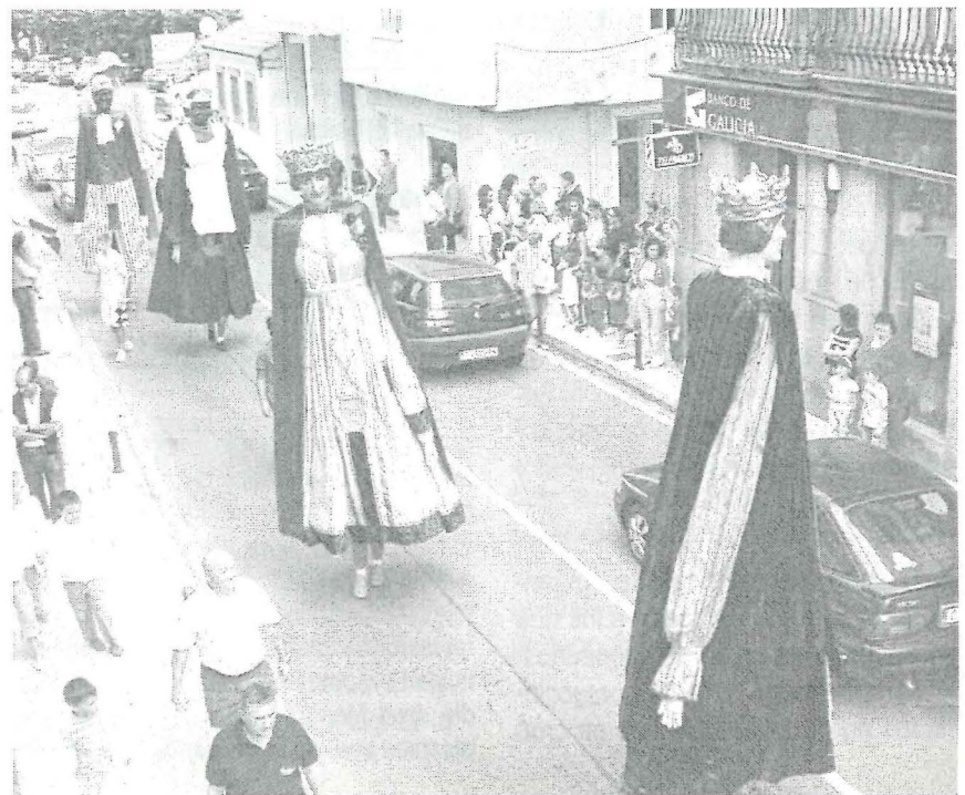
Los gigantes de A Pobra en 2007