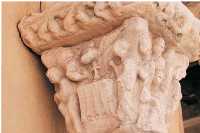
Fig. 6: Capitel del pórtico norte de S. Martín de Segovia