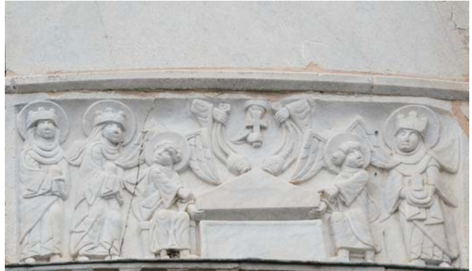
Fig. 8: La visita de las Marías al sepulcro. Relieve del ábside de Saint-Paul-les-Dax (Landas)

Por último, tenemos el testimonio del arte que refleja el conocimiento de las prácticas litúrgicas dramáticas y permite suponer razonablemente su existencia en lugares y épocas de las que no se conservan textos. Ciñéndonos a nuestro caso, parece evidente que el escultor del tímpano segoviano conocía las ceremonias de la Visitatio Sepulchri y aunque ello no pruebe de manera concluyente, a falta de textos, que éstas tuviesen lugar en Segovia, supone un indicio claro que sumar a los datos algo más tardíos del Sínodo de Cuéllar (1325) en el que se alude, para condenarlos, a ciertos juegos aunque permitiendo los "de las fiestas, así como de las Marias e del monumento ..." 19 . Parece indudable que se hace alusión a