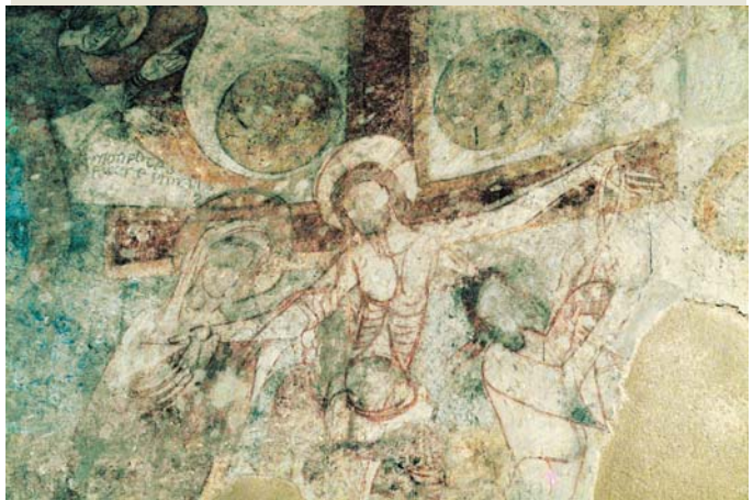
Fig. 9: Desenclavo. Muro del ábside de San Justo (lado de la Epístola)