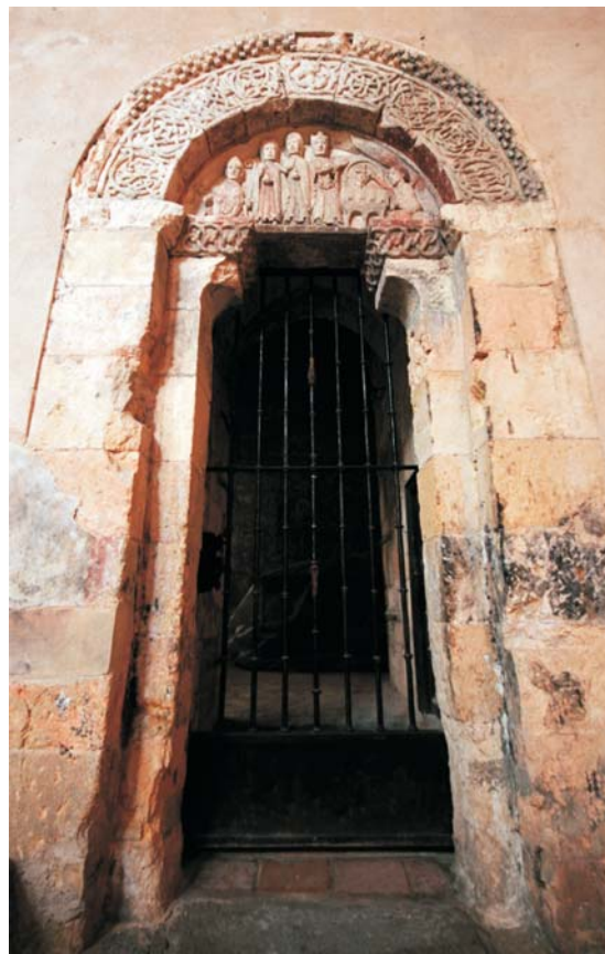
Fig. 1: Puerta de la torre desde la iglesia

Las interpretaciones que se han hecho de la escena son variadas: su descubridor, el Marqués de Lozoya, creyó en primera instancia ver en ella el episodio de la inventio de las reliquias de los mártires Justo y Pastor, opinión aceptada por otros autores