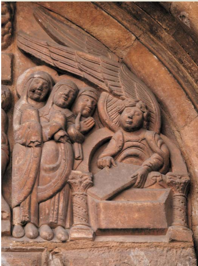
Fig. 7: Tímpano de la Puerta del Perdón de S. Isidoro de León

Es conocida la polémica entre los estudiosos del teatro medieval peninsular sobre la existencia y difusión de los dramas litúrgicos en Castilla y resulta evidente la disimetría que existe, en el número de textos conservados, entre el área catalanoaragonesa, donde los textos son abundantes y variados, y la zona castellana, donde escasean y parecen todos derivados de modelos franceses o catalanes 12 . Cataluña fue, sin duda, uno de los grandes centros del drama litúrgico a nivel europeo. Ripoll, Vic, Gerona y Palma de Mallorca, entre otras muchas iglesias, produjeron dramas litúrgicos pascuales de los que conservamos una veintena, algunos muy originales e incluso pioneros como el De Tribus Mariis de Vic. Del área castellano-leonesa proceden, por el contrario, muy pocos casos (dos de Silos y uno de Compostela), que los que postulan la inexistencia de tradición dramática en Castilla consideran simples excepciones, explicables por el alejamiento de Silos de la órbita cluniacense y por contactos puntuales con cenobios catalanes, propiciados por el auge de las predicaciones, en el caso de Santiago.