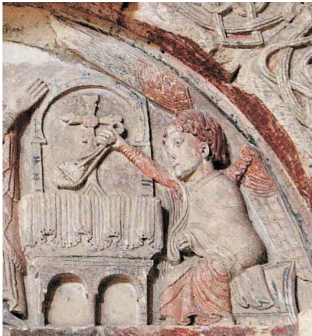
Fig. 4: El ángel incensando la cruz y el altar-sepulcro

> Fig. 5: El tímpano con la policromía que lucía cuando fue descubierto (foto en Marqués de Lozoya (1970), lam XIV)